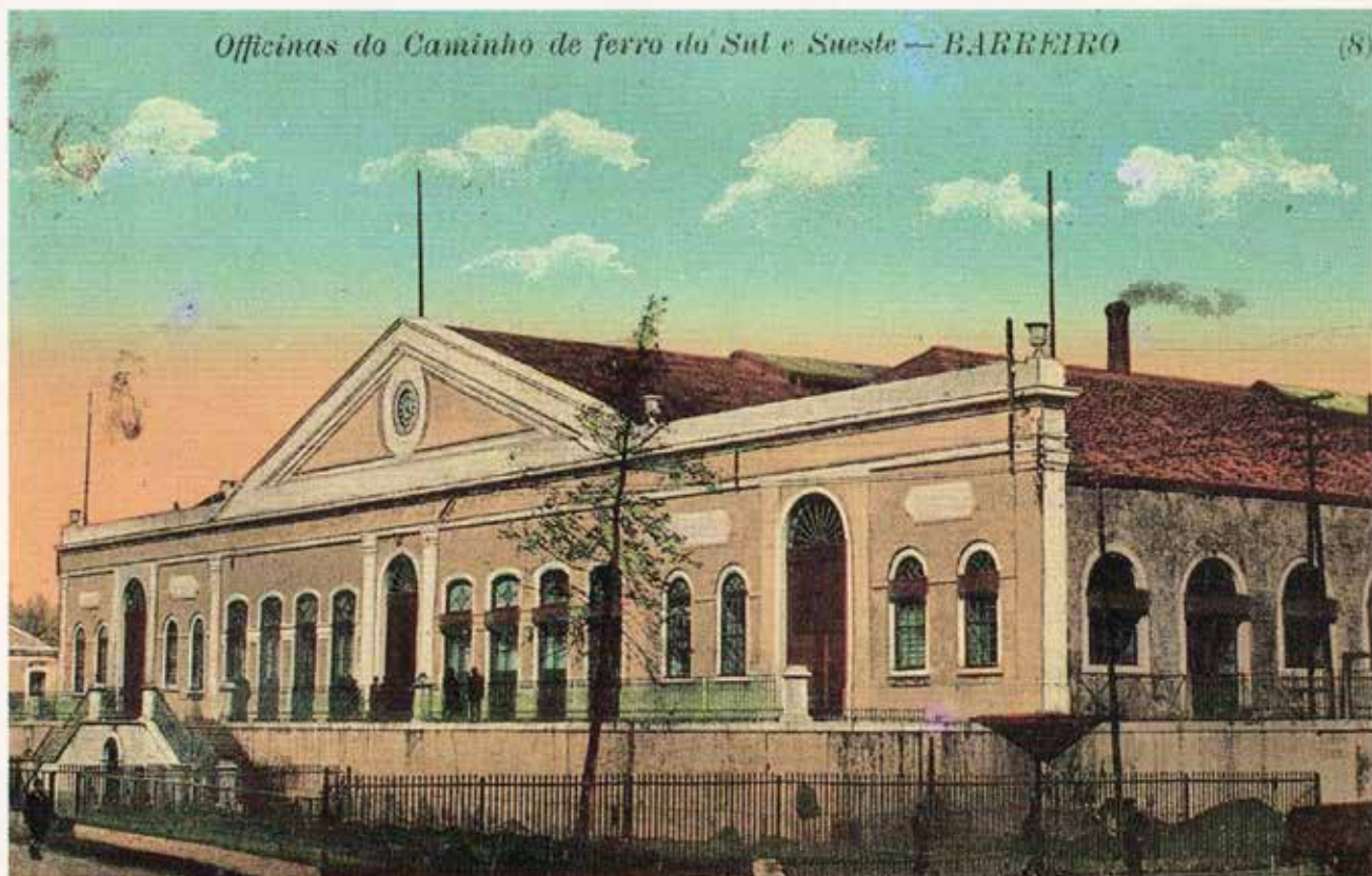
BARREIRO — Oficinas Geraes