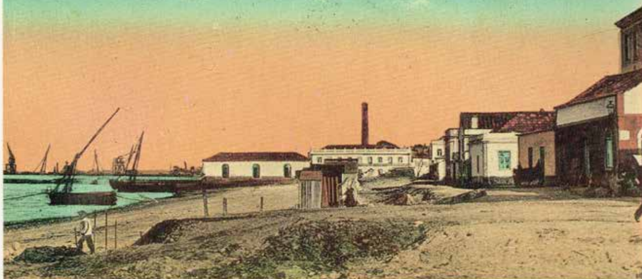
Companhia União Fabril — BARREIRO VISTA DO PONTE