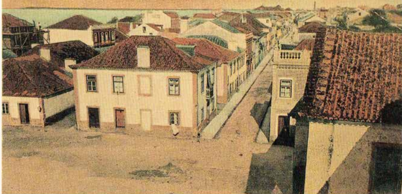
Companhia União Fabril — BARREIRO (VISTA DO POENTE)